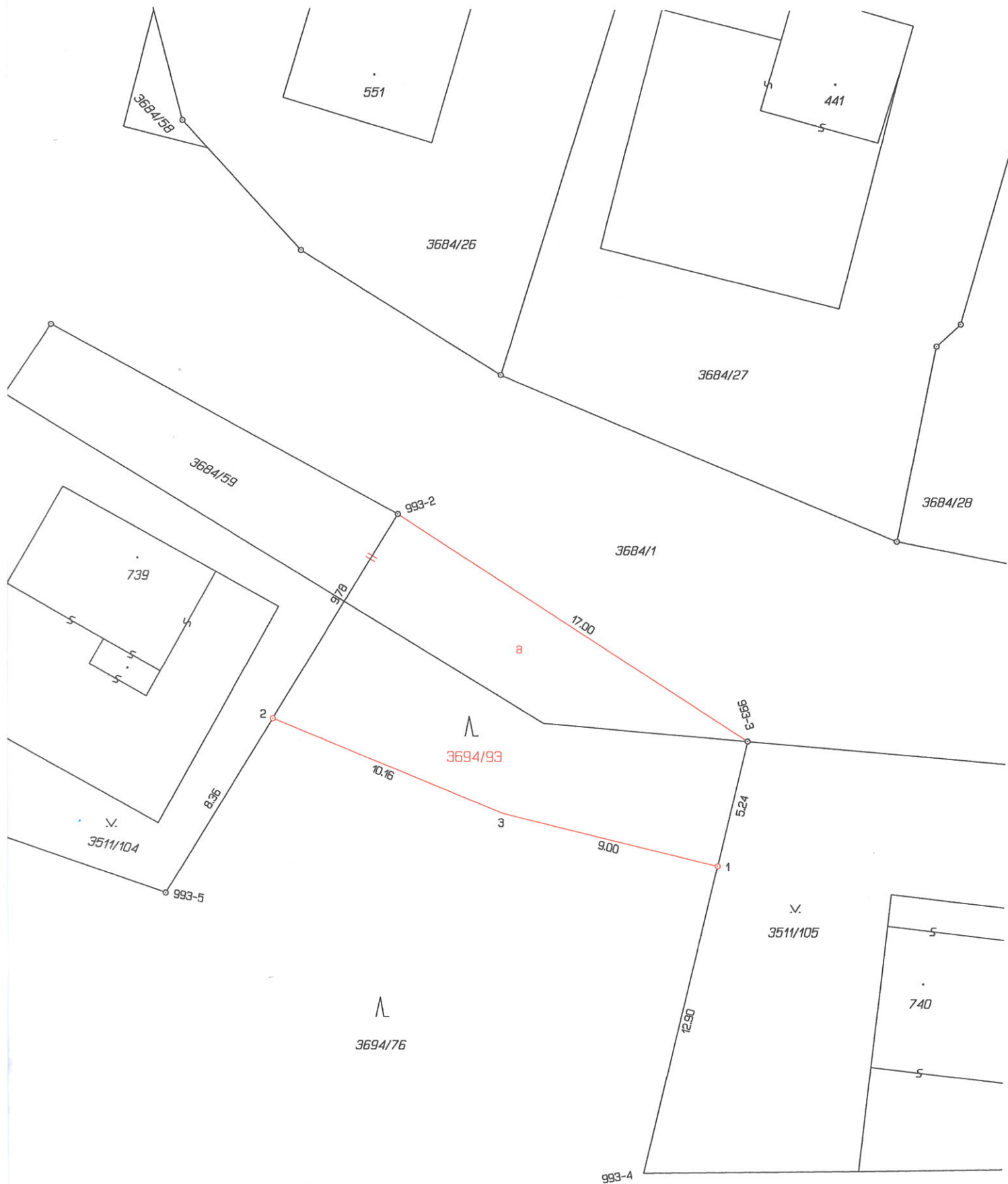
Seznam souřadnic (S-JTSK) Číslo bodu Souřadnice pro zápis do KN Y X Kód kv. Poznámka